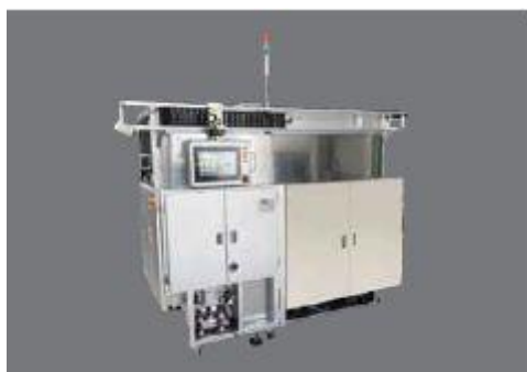
ヒートセパレーター (HS-II)